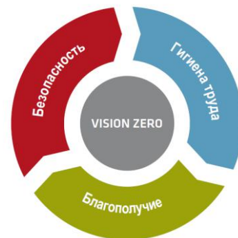
Рис. 1. Семь «золотых правил» производства с нулевым травматизмом и безопасными условиями труда (концепция «Нулевого травматизма» (Vision Zero))

« Vision Zero » или « Нулевой травматизм » – качественно новый подход к организации профилактики, объединяющий три направления – безопасность , гигиену труда и благополучие работников на всех уровнях производства